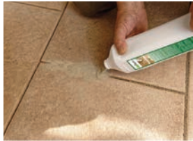
Reparatursand in die Fuge füllen

härtet nach Befeuchtung aus. Stark unkruthemmende Wirkung.