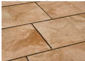
24 Stunden durchtrocknen lassen