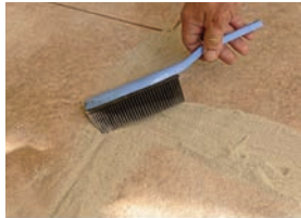
Reparatursand in die Fuge einfeigen