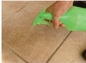
Fugensand in Fuge befeuchten